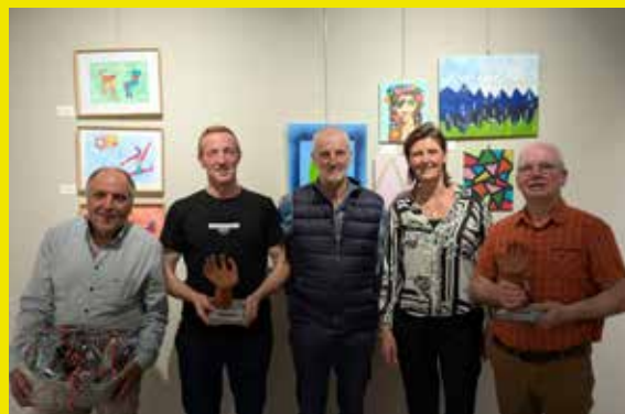
Landelijke Gilde Lozen, culturele vereniging van 2025

We kijken uit naar jullie inzendingen en naar een feestelijke avond vol culturele waardering!